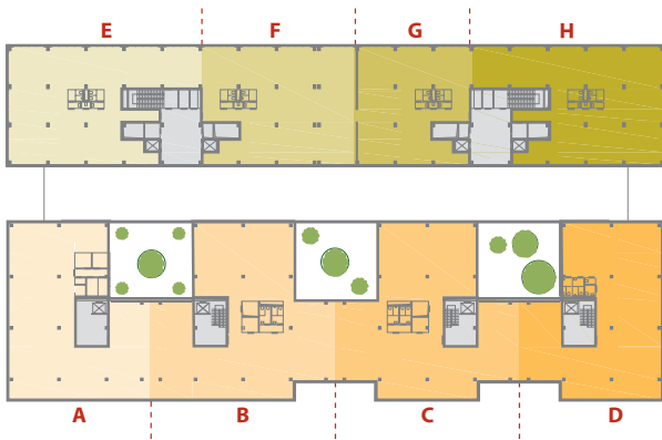
Schéma budovy Building Layout